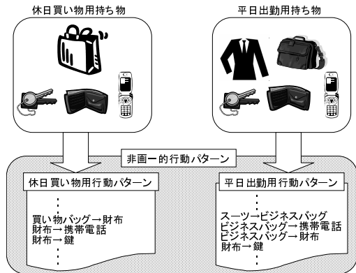
図 2: 非画一的行動パターン